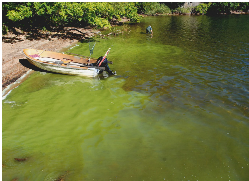
12 september 2016 – badstranden, Pumpviken

Nederbörd i Klagstorp (enkel plastmätare): jan 42, feb 59, mars 35, april 53, maj 18 ! , juni 38, juli 125, aug 66, sept 7!!!, okt 118, nov 79 och dec 41 mm. Totalt 681. . Lägsta vattenstånd i Ivösjön – oktober 5,37 m.ö.h. B. Almer