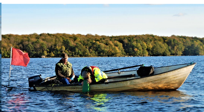
12 okt 2020 stn 65